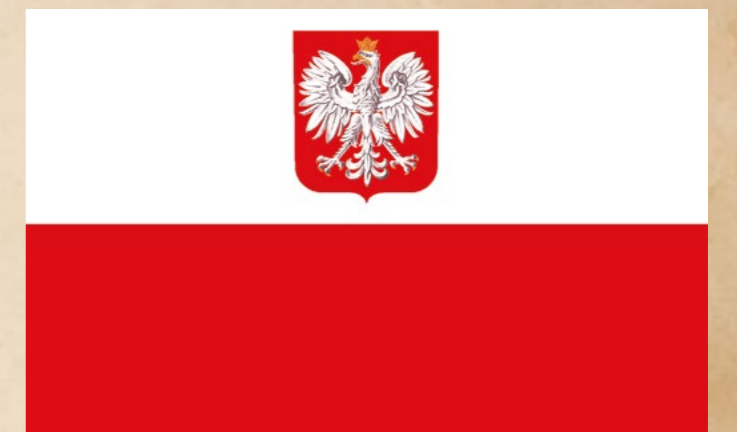
Flaga państwowa z herbem RP

Ustawa z 2004 r. ustanowiła też dzień 2 maja „Dniem Flagi Rzeczypospolitej Polskiej”, z tym, że nie jest to święto, z którym łączy się dzień wolny od pracy 46 . Do najważniejszych intencji, które przyświecały idei ustanowienia Dnia Flagi Polskiej, należy potrzeba uzupełnienia dość skąpej wiedzy naszego społeczeństwa na temat historii symboli ojczystych. Dzień Flagi w założeniu ma mieć charakter edukacyjny i ma służyć propagowaniu polskich symboli państwowych