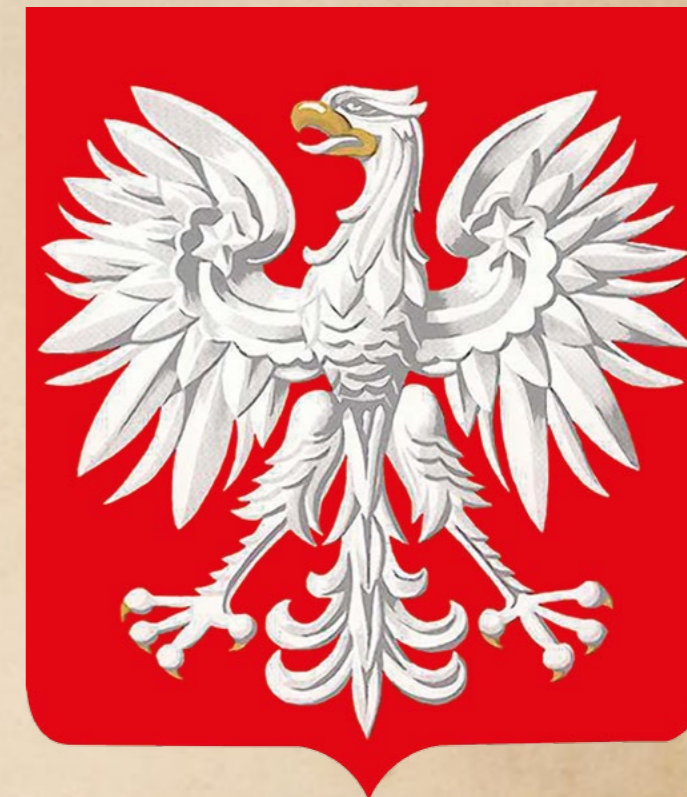
Herb PRL od 1955 roku

Dopiero kilka lat później, dekretem Rady Państwa z 7 grudnia 1955 r. 22 (O godle, barwie i hymnie Polskiej Rzeczypospolitej Ludowej) za herb państwowy przyjęto zasadniczy wzór herbu z 1927 r. Tarcza herbowa została pozbawiona złotej obwódki, orzeł miał nieco szersze łapy i ogon oraz łagodniej zakrzywiony dziób. Najistotniejszą sprawą było jednak to, że zdjęto koronę z głowy Orła Białego, aby herb był bardziej „ludowy” i „demokratyczny”. Z heraldycznego punktu widzenia było to uszczerbienie herbu i przerwanie wielowiekowej tradycji koronowanego Orła Białego jako herbu państwa polskiego. Większość społeczeństwa uważała, że jest to wyraz braku pełnej suwerenności państwowej.