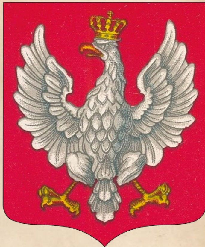
Herb Polski (1919-1927)

Polska odrodzona w 1918 r. po okresie zaborów, obrała za swój znak uświęconego wielowiekową tradycją Orła Białego w koronie. Pierwszym urzędowym godłem Polski miał być jednak orzeł bez korony, ponieważ krótkotrwały (XI 1918 - I 1919) rząd Jędrzeja Moraczewskiego, składający się głównie z socjalistów i radykalizujących ludowców, dyrektywą ministra spraw wewnętrznych Stanisława Thugutta, próbował (rozporządzenie nie zdążyło wejść w życie) wprowadzić orła bez korony. Wywołało to jednak falę protestów społecznych 10 . Powstało nawet powiedzenie „Za Thugutta zrobili z orła koguta” 11 . Ogłoszony w lipcu 1919 r. konkurs na rysunek herbu państwa nie przyniósł oczekiwanych rezultatów 12 . W tej sytuacji, do czasu uchwalenia konstytucji, Sejm w dniu 1 sierpnia 1919 r. przyjął tymczasowy wzór herbu Rzeczypospolitej Polskiej 13 . Przedstawiał on w czerwonym polu tarczy Orła Białego w złotej koronie zwieńczonej krzyżem, ze złotym dziobem i złotymi szponami. Tekstowi ustawy towarzyszył jedynie wzór pieczęci Rzeczypospolitej, na której orzeł był identyczny do orła herbowego 14 . Orzeł ten, choć nawiązywał w rysunku do klasycystycznego orła Rzeczypospolitej z końca XVIII w., był mało udany artystycznie i od samego początku jego postać wywoływała głosy krytyki.