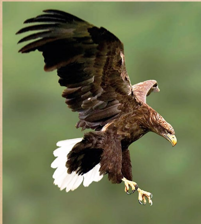
Bielik zwyczajny

Za orłem przednim w herbie przemawia m.in. fakt, że jest on bardziej drapieżny niż bielik. Bielik bywa również ścierwojadem, zwłaszcza zimą, gdy zamarzają rzeki i jeziora (orzeł przedni tylko sporadycznie i dotyczy to świeżej padliny). Nasi przodkowie dobrze znając świat przyrody - w tym i życie orłów- za swój znak wybrali zapewne orła „bardziej bohaterskiego”. Cechą, która wskazywałaby z kolei na orła bielika, jest gruby i mocny, koloru żółtego, dziób heraldycznego ptaka. Skoki czyli łapy orzeł z naszego godła ma nagie, czyli takie jak bielik. Opierzone skoki to cecha orłów.