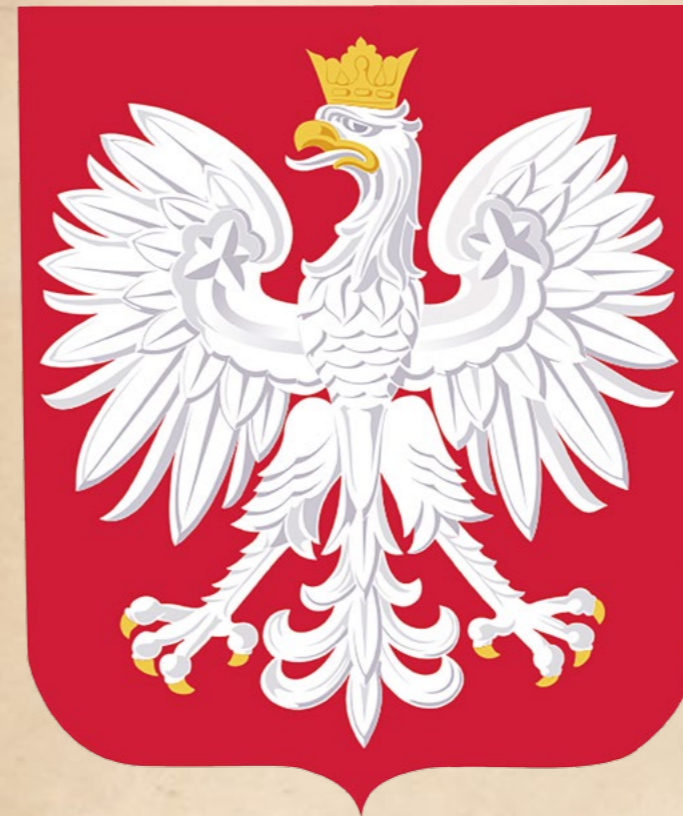
Herb Rzeczypospolitej Polskiej od 1990 roku