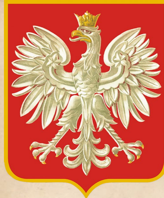
Herb Polski od 1927 roku