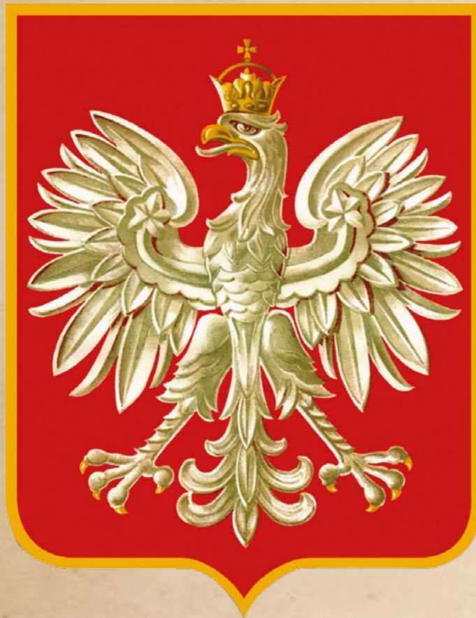
Herb Polski na Obczyźnie od 1956 roku

Niewielkich retuszy herbu Polski Ludowej dokonano ustawą z 31 stycznia 1980 r. 24 , zmieniając np. barwę tarczy herbowej z cynobru na ciemniejszą czerwień.