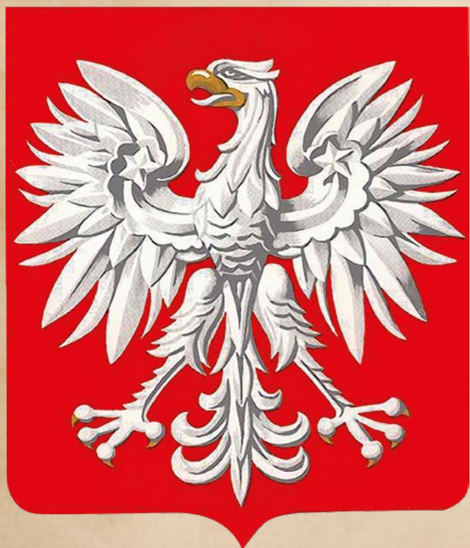
Herb PRL od 1980 roku

Niewielkich retuszy herbu Polski Ludowej dokonano ustawą z 31 stycznia 1980 r. 24 , zmieniając np. barwę tarczy herbowej z cynobru na ciemniejszą czerwień.