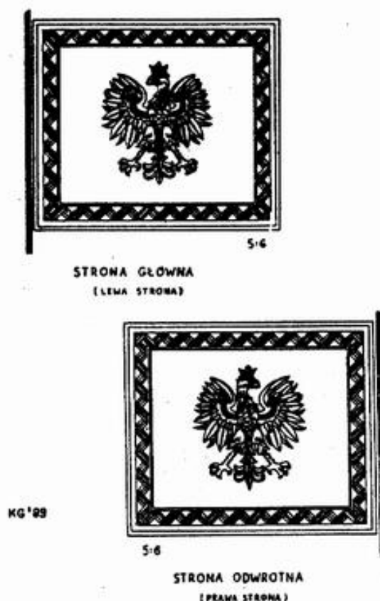
Ryc. 5. Proporzec Prezydenta Rzeczypospolitej wg propozycji Autora, zawartej we wniosku z dn. 29 września 1989 r. „W sprawie godła i barw Państwa Polskiego

w sprawie przywrócenia Chorągwi Rzeczypospolitej i ustanowienia odrębnego znaku - Proporca Prezydenta RP (autor wniosku - w przeciwieństwie do koncepcji przyjętej w latach Drugiej Rzeczypospolitej - proponuje rozdzielenie dwóch funkcji: godła państwowego i znaku oso-