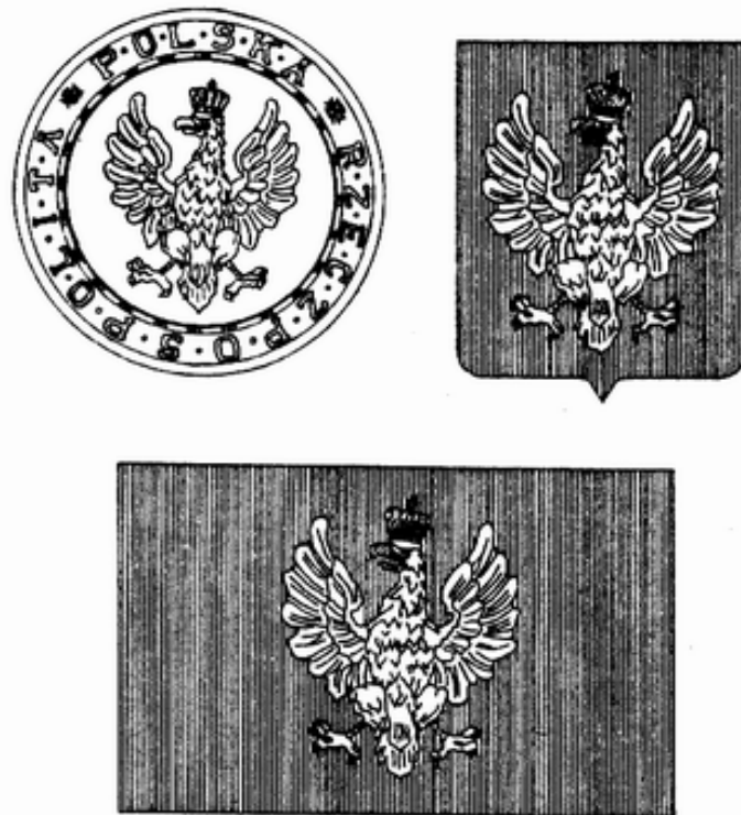
Ryc. 1. Trzy godła państwowe: Pieczęć RP. Herb RP i Chorągiew RP wg Ustawy z dnia 1 sierpnia 1919 r. o godłach i barwach Rzeczypospolitej Polskiej.