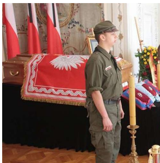
Pożegnanie śp. Ryszarda Kaczorowskiego, Prezydenta Rzeczypospolitej na Uchodźstwie w Belwederze. Wystawiona publicznie trumna okryta Proporcem Prezydenta obszytym złotą frędzlą