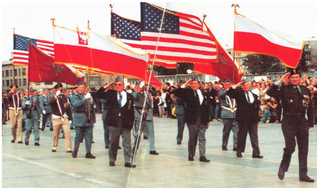
Parada Polonii amerykańskiej z flagami obszytymi złotymi frędzlami.[7] Światowy Zjazd Polskich Kombatantów - Warszawa, 14-15 sierpnia 1992 r. Defilada kombatantów polskich ze Stanów Zjednoczonych przed Grobem Nieznanego Żołnierza.

Tradycyjny zwyczaj obszywanie narodowej flagi frędzlami przyjął się wśród Polonii amerykańskiej – stąd też na polonijnych paradach w Stanach Zjednoczonych można często zaobserwować polskie flagi biało-czerwoną i biało-czerwona z herbem Orzeł Biały na białym pasie obszytą złotymi frędzlami !