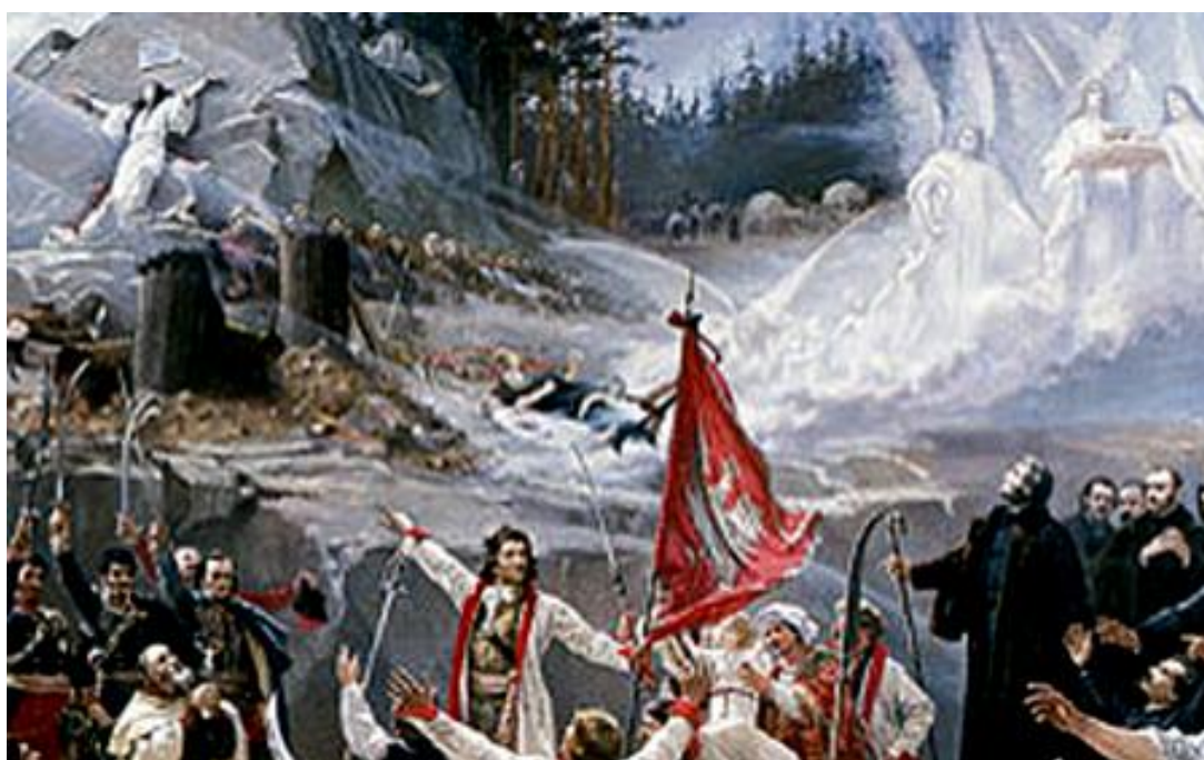
Fragment obrazu "Polonia" : Polska w białej szacie bez winy zniewolona, przykuta do skały (po lewej u góry), ale Matka Boska Królowa Polski nad nami czuwa (po prawej u góry), w centrum Tadeusz Kościuszko z chorągwią z białym orłem na czerwonym bławacie.

Obraz Jana Styki stał się inspiracją do opracowania Chorągwi Polonii . Sięgnięto więc do wspaniałych tradycji historii Dawnej Polski i na tej bazie powstał autorski projekt weksylium dla amerykańskiej Polonii.