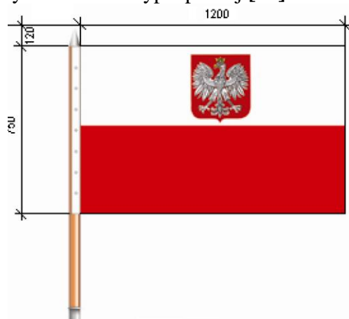
Flaga państwowa RP z godłem wprowadzona w Wojsku Polskim – sposób mocowania do drzewca

Z kronikarskiego obowiązku odnotujmy iż w 2007 r. wprowadzono do ceremoniału Wojska Polskiego flagę RP z godłem przytwierdzoną do drzewca, przeznaczoną do używania przez podczas oficjalnych uroczystości poza granicami kraju i w kontaktach międzynarodowych na terytorium Rzeczypospolitej [14].