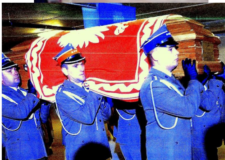
Trumna ś.p. Ryszarda Kaczorowskiego podczas drugiego pochówku w Świątyni Opatrzności Bożej – płat Proporca Prezydenta nie jest obszyty frędzlą.

W listopadzie 2012 r. w ramach ustaleń z NATO przybył do Polski pierwszy pododdział amerykańskich sił zbrojnych lotniczych – Aviation Detachment – i na lotnisku wojskowym w Łasku odbyła się oficjalna ceremonia powitania. [13]