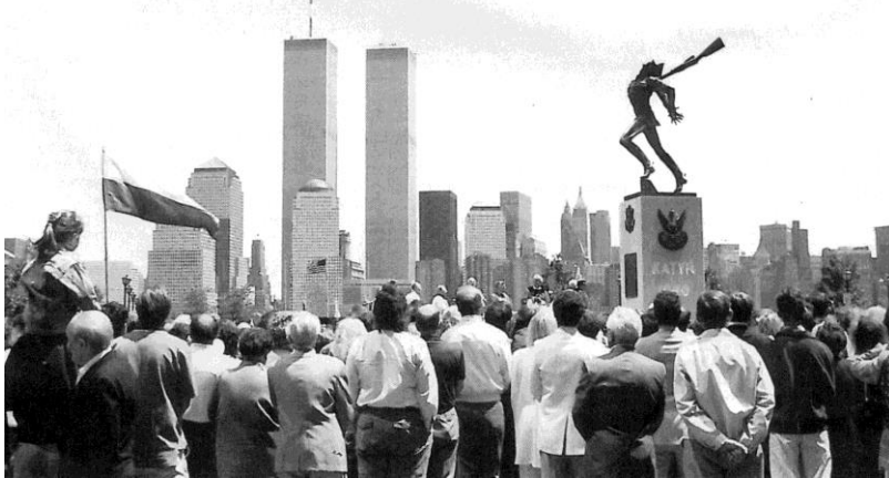
Bialo-Czerwona podczas uroczystości odsłonięcia Pomnika Katyńskiego - New Jersey, NY 1980