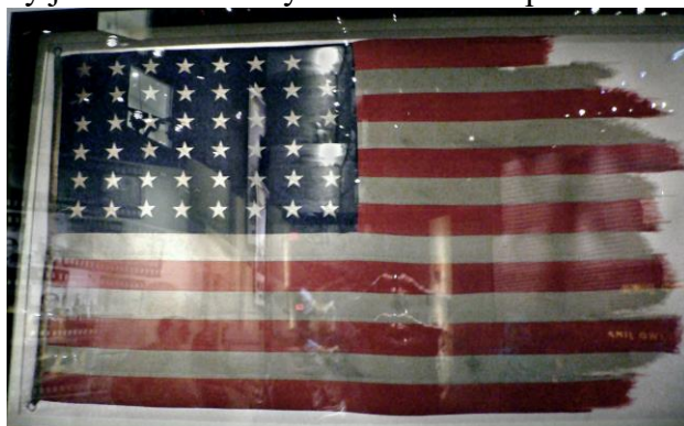
Oryginał postrzępionej przez wiatr flagi z góry Suribachi

" The Flag " na stałe weszła do panteonu amerykańskich symboli narodowych, Jej oryginał przechowywany jest w Narodowym Muzeum Korpusu Piechoty Morskiej USA.