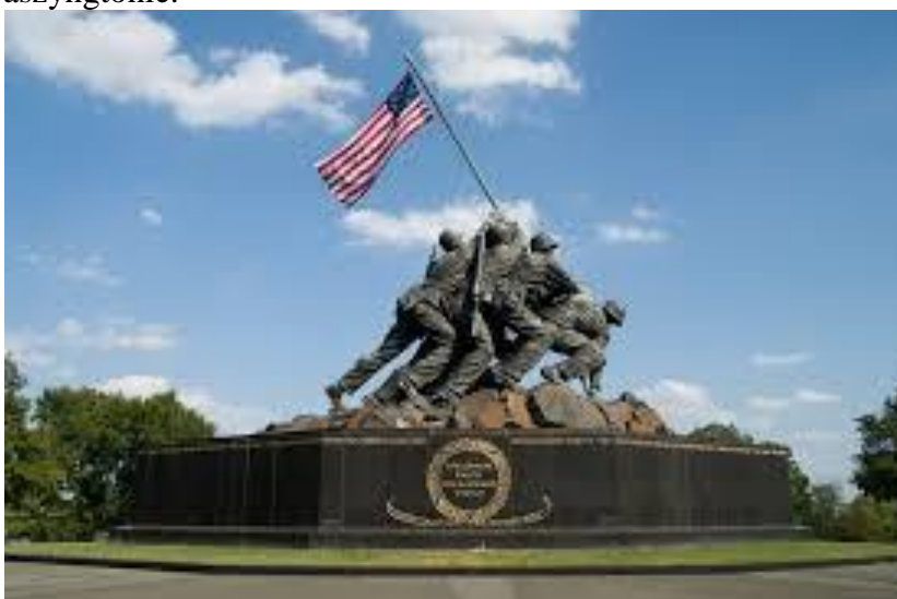
Pomnik Wysiłku Wojennego Korpusu Piechoty Morskiej

W 1954 roku rzeźbiarz Felix de Weldon stworzył – na podstawie zdjęcia Rosenthala – monumentalny pomnik Wysiłku Wojennego Korpusu Piechoty Morskiej (ang.: USMC War Memorial ) w Waszyngtonie.