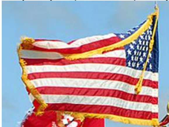
Amerykańska flaga narodowa obszyta złotymi frędzlami

Zgodnie z tradycjami płachta flagi amerykańskiej (zwanej w literaturze przedmiotu National Flag ) może być obszyta złotymi frędzlami dla zwiększenia jej piękna.