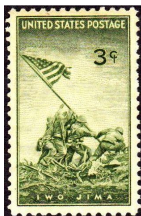
Znaczek pocztowy z grupą Marine's z Iwo Jimy

" The Flag " na stałe weszła do panteonu amerykańskich symboli narodowych, Jej oryginał przechowywany jest w Narodowym Muzeum Korpusu Piechoty Morskiej USA.