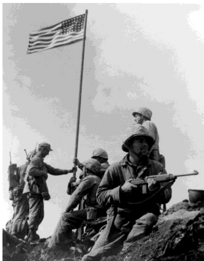
Pierwsza flaga wzniesiona nad szczytem Suribachi.

Na szczycie Marine's już 25 lutego 1945 r. zatknęli dwie flagi amerykańskie. Pierwsza z nich była zbyt mała i słabo widoczna z plaż – więc znaleziono większą, o wymiarach 2,5 x 1,5 m.