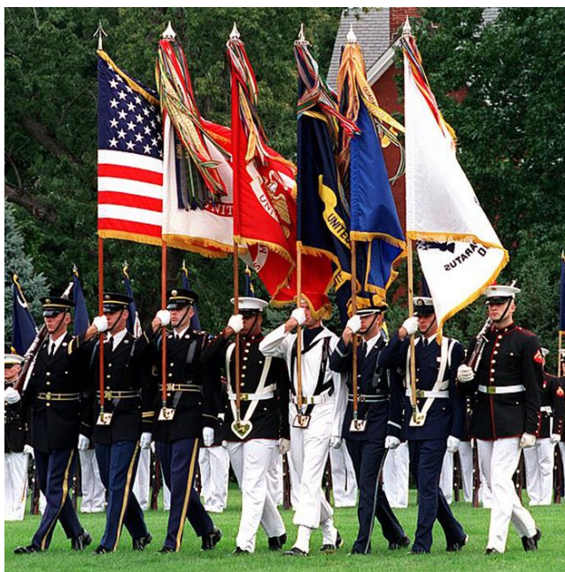
Parada wojskowa w Fort Myer, Virginia w listopadzie 2001 r.

Ozdobione frędzlami flaga narodowa wraz z flagami rodzajów sił zbrojnych USA są więc tradycyjnie prezentowane podczas wszelkich oficjalnych parad.