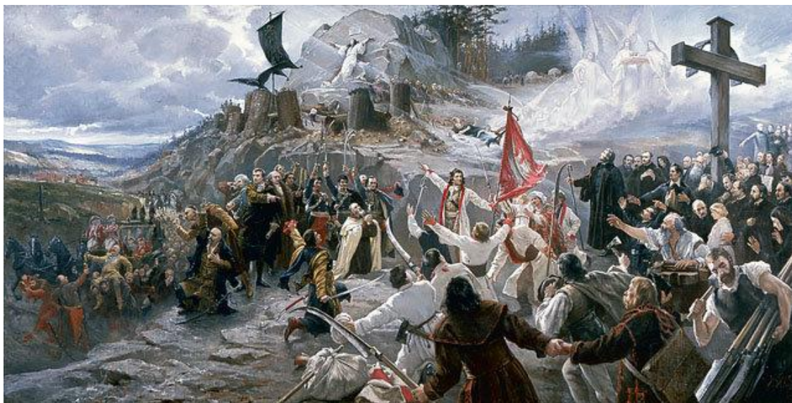
Monumentalna, narodowa alegoria z roku 1891 – obraz "POLONIA" Jana Styki .[*]

Tym oto sposobem Polonia amerykańska identyfikując się ze swoją Ojczyzną mogłaby występować pod Znakiem Orła Białego – jak na obrazie Jana Styki z alegorią Polonii ! Ale jakim ?