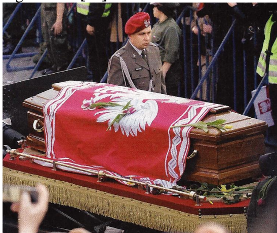
Proporzec Prezydenta Rzeczypospolitej wz. 1996 jako zwierzchnika Sił Zbrojnych RP i trumna ze szczątkami śp. Lecha Kaczyńskiego okryta Proporcem

Nieco odmienna była ceremonia pogrzebowa śp. Ryszarda Kaczorowskiego, Prezydenta Rzeczypospolitej na Uchodźstwie. Podczas ceremonii Jego pożegnania w Belwederze trumna była okryta również Proporcem Prezydenta [11] – jednakże płat proporca był obszyty złotą frędzlą mimo iż wśród oficjalnych weksyliów państwowych Trzeciej Rzeczypospolitej nie ma takiego znaku.