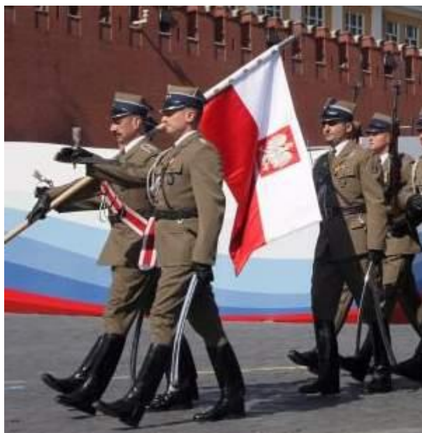
Defilada w Moskwie - 9 maja 2010 r.

Z tego typu dość kuriozalną chorągwią obcą tradycjom Wojska Polskiego [15], wystąpił poczet sztandarowy kompanii reprezentacyjnej WP podczas defilady w Dniu Zwycięstwa w Moskwie.