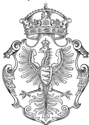
Herb króla Stefana Batorego wg herbarza Paprockiego

Na czerwonym bławat barwy karmazynu polskiego wprowadzono wizerunek Orła Białego z czasów świetności Rzeczypospolitej – z herbu Stefana Batorego [**], a więc z rodzowym herbem króla "Wilcze Kły".