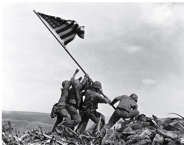
Druga flaga na szczycie Suribachi w fotografii Rosenthala.

Obecny na miejscu reporter wojenny Rosenthal wykonał zdjęcie tej drugiej flagi i zostało no błyskawicznie, bo w ciągu 48 godzin (sic !), opublikowane w amerykańskiej prasie wzbudzając wśród zmęczonych już wojną Amerykanów entuzjazm.