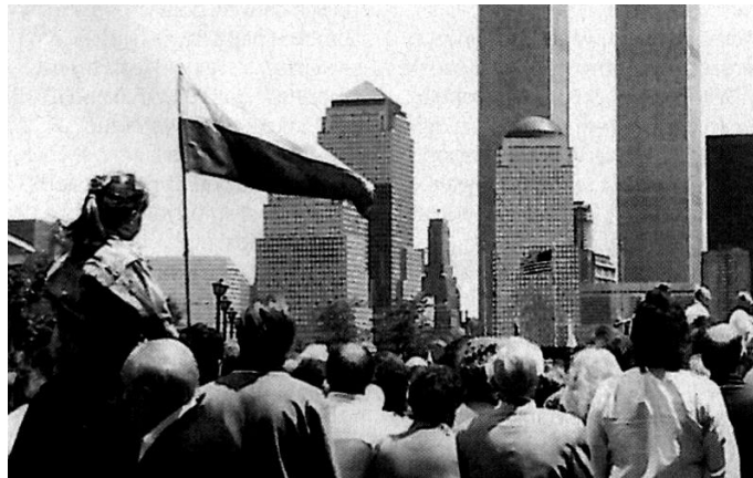
Bialo-Czerwona czyli flaga o polskich barwach narodowych

Nie jest natomiast weksylologicznym nadużyciem powiewająca Bialo-Czerwona – a więc flaga o polskich barwach narodowych – podczas odsłonięcia Pomnika Katyńskiego, ufundowanego przez Polonię w Nowym Jorku. Jak widać na poniższym zdjęciu – nie ma ona złotych proporcji Pitagorasa 5 : 8, przewidzianych dla flagi państwowej Rzeczypospolitej Polskiej.