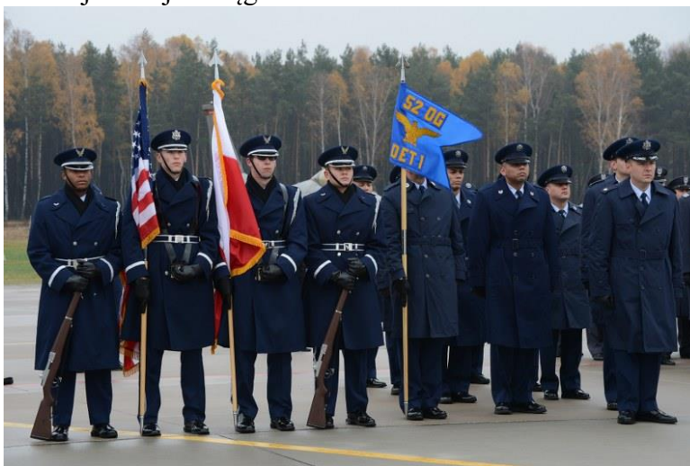
Pododdział amerykańskich wojsk lotniczych na lotnisku w Łasku – 11 listopada 2012 r. W poczcie sztandarowym flaga narodowa USA i flaga biało-czerwona Rzeczypospolitej obszyte złotymi frędzlami, po prawej niebieski proporzec (guidon) pododdziału.

W historii polskich symboli państwowych był t pierwszy tego typu przypadek gdy przytwierdzona do drzewca płachta flagi państwowej Rzeczypospolitej została – zgodnie z wojskowym ceremoniałem US Army – obszyta złotą frędzlą, W ten sposób nadano temu wksylium charakter wojskowej chorągwi !